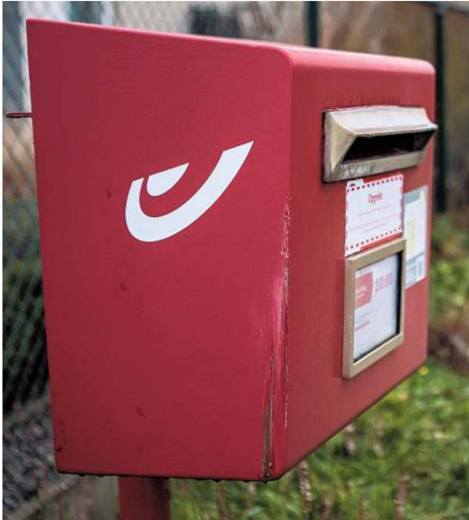
Tegen eind maart neemt Bpost 221 postbussen in onze provincie weg.

Bpost haalt de komende weken 221 rode postbussen weg uit West-Vlaanderen. Welke bussen er verdwijnen, wil Bpost niet medelen maar Krant van West-Vlaanderen kon de lijst volledig reconstrueren. Daarbij blijkt dat vooral Zuid-West-Vlaanderen in de klappen deelt. Zeven burgemeesters zullen protest aantekenen. "Ze kijken enkel naar het aantal brieven per bus, niet naar de lokale situatie."