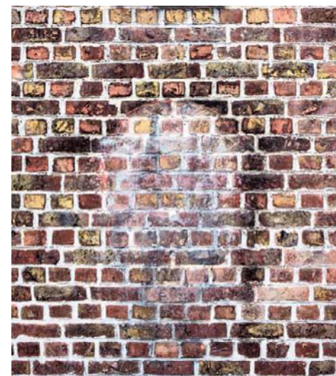
Van de postbus in de Hooistraat in Brugge blijft enkel nog een afdruk over.

Hier blijft alles bij het oude: Alveringem (9), Damme (16), Dentergem (7), Gistel (14), Kortemark (10), Langemark-Poelkapelle (8), Lendeledede (5), Lo-Reninge (6), Mesen (1), Moorslede (7), Oostrozebeke (6), Ruiselede (6), Vleteren (7) en Zuienkerke (7).